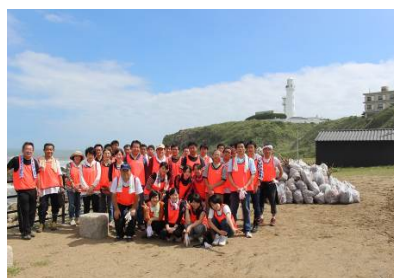
40名のボランティアが参加！

北関東に降り続いた豪雨の影響で君ヶ浜にも 多量のゴミが漂着しました。そこで美しい海岸を 取り戻すため、海岸の清掃活動を行い、約900 袋もの多量のゴミを回収しました。