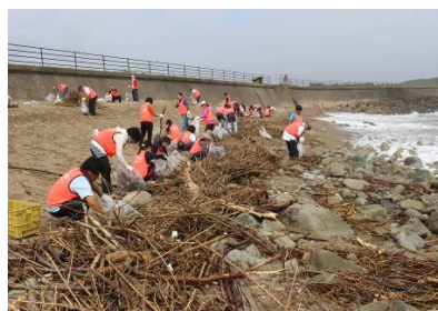
大量に流れ着いた流木↑