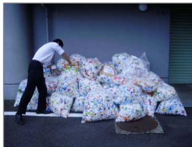
全店から集められたキャップ

※ 累計のキャップをゴミとして焼却すれば、これだけの量のCO 2 が発生することになります。