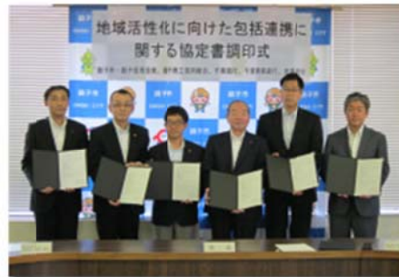
「銚子市との連携協定書の締結」