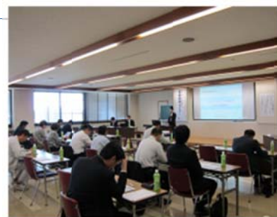
「事業承継セミナー」