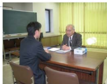
「お客さま無料相談会」