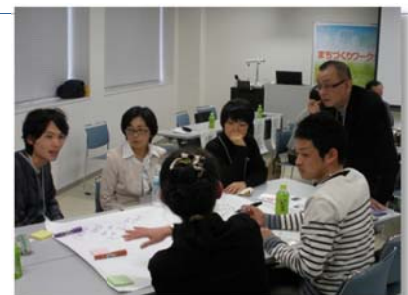
「銚子円卓会議 まちづくりワークショップ」