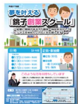
「銚子創業スクール」