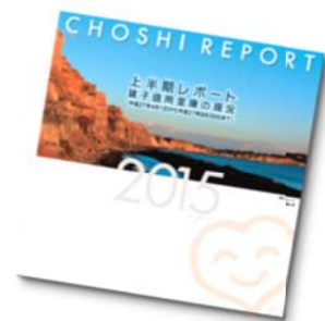
「2015年 上半期レポート」