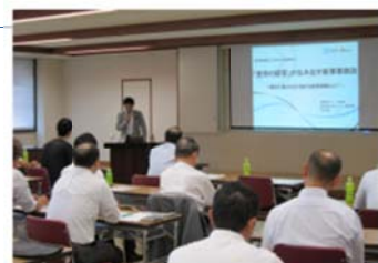
「ちょうしんきん経営塾 21」

第 9 回 「トップとして押さえるべき財務」(平成 28 年 2 月 16 日)