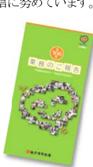
「第106期 業務のご報告」

「地域密着型金融推進計画」の具体的な取組みについては、会員向けに発行している「業務のご報告」や、7月と11月の年2回発行するディスクロージャー誌および当金庫ホームページに掲載し、地域や利用者のみなさまに対する情報発信に努めています。