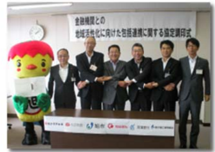
「旭市との連携協定書の締結」