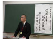
「ビジネス特別講義」

千葉科学大学において、当金庫理事長が講師となり、同大学危機管理学部の学生を対象にビジネス特別講義を実施しました。