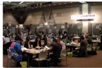
「平成27年しんきん食の商談会」