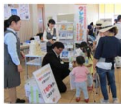
「さんさん★フェスタ 2015」

また、平成 27 年 6 月 7 日に千葉県民の日を記念した海匝地区のイベント「さんさん★フェスタ 2015」が千葉科学大学マリーナキャンパスを会場に開催され、当金庫ブースでは、模擬紙幣を利用した職場体験や名刺の作成などを行い、多くの子供たちに楽しんでいただきました。