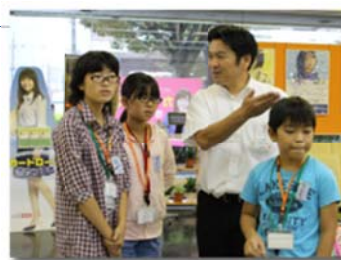
「ゆめ・仕事びったり体験」