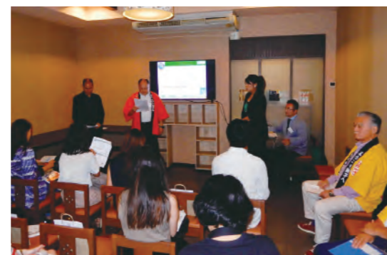
タイ・バンコクでのプレスイベントの様子

2019年度は、2018年度に引き続きタイ・バンコクでの商談会を開催した他、現地メディア向けのイベントも実施し、タイの方々へ銚子地域の魅力を発信しました。