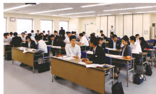
経営サポート研修会