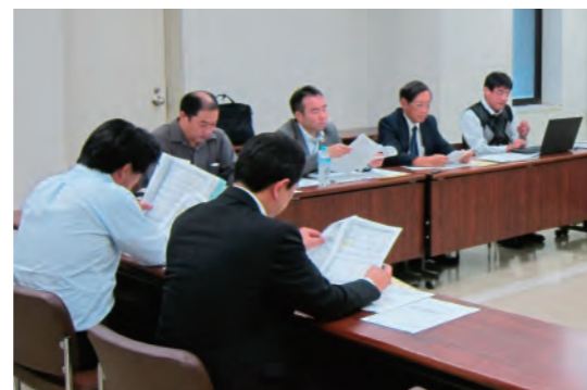
経営改善計画のご提案