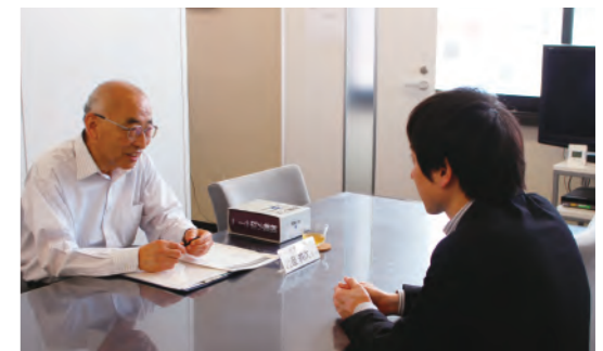
お客さま無料相談会

法律・税務相談については月1回、年金・労務管理の相談については随時受付しています。