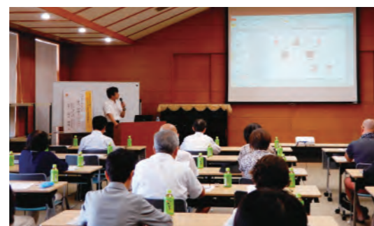
ウレシイくらしのセミナー

「地域のお客さまへ、日常の暮らしに直結する様々な情報をご提供すること」を目的に、2018年度から「ウレシイくらしのセミナー」を各地区で開催しています。2019年度は、神栖市・旭市で「遺言・相続」をテーマに、銚子市で「認知症予防」をテーマで開催し、延べ159名のお客さまにご参加いただきました。