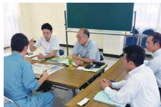
事業承継の個別相談会

M&A支援については、(株)ランピアや信金キャピタル(株)等と連携して取り組んでいるほか、小規模なM&Aの実現を支援する独自サービス「ちょうしんきんM&Aサポート」を新たに開始しました。当金庫の持つ情報ネットワークを最大限に活用してM&A情報の提供を行うとともに、専門家と連携しながら一貫したサポートを行っています。