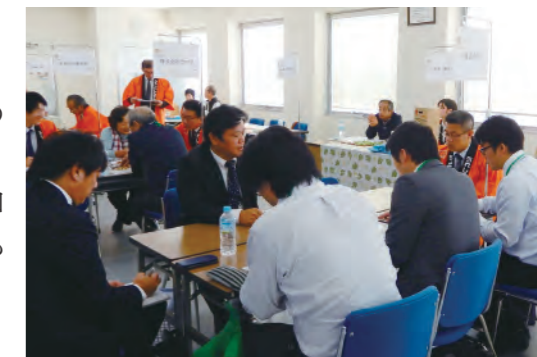
第2回旭ウレシイ商談会

2018年度に続く2回目の開催となった今回も、多くの方にご参加いただき、60件を超える商談が行われ、地元事業者同士の交流も盛んに行われました。