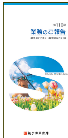
第110期 業務のご報告

「地域密着型金融推進計画」を策定し、中小企業金融の円滑化と地域経済の発展に向けて取り組んでいます。「地域密着型金融推進計画」の具体的な取組みについては、7月と11月の年2回発行するディスクロージャー誌および当金庫ホームページへ掲載し、地域の利用者のみなさまに対する情報発信に努めています。