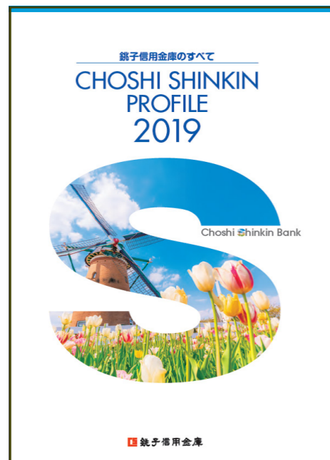
銚子信用金庫のすべて2019