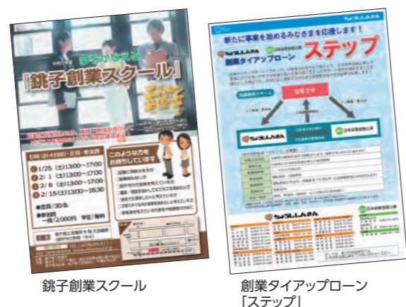
銚子創業スクール