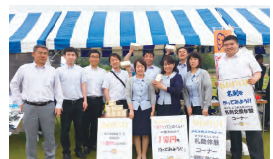
さんさん★フェスタ2019

千葉県民の日を記念した海匠地区(銚子市・旭市・匝瑳市)のイベント「さんさん★フェスタ2019」が、匝瑳市「そうさ記念公園」を会場に開催されました。当金庫のブースでは、模擬紙幣を利用した職場の体験や名刺の作成などを行い、多くの子どもたち楽しんでいただきました。