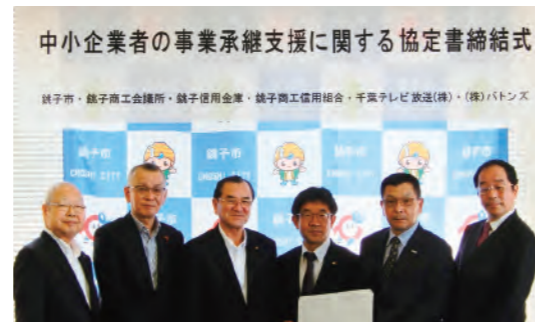
事業承継支援に関する協定の締結式

地域経済における喫緊の課題である中小事業者の事業承継を円滑に推進し、地域の活性化を目指す活動に積極的に取り組んでいます。2019年度は、銚子市、銚子商工会議所、銚子商工信用組合、千葉テレビ放送(株)及び事業承継・M&A支援サイトを運営する(株)バトンズと事業承継支援に関する協定を締結しました。