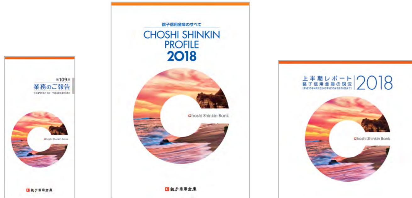
第109期 業務のご報告

「地域密着型金融推進計画」の具体的な取組みについては、7月と11月の年2回発行するディスクロージャー誌および当金庫ホームページへ掲載し、地域の利用者のみなさまに対する情報発信に努めています。