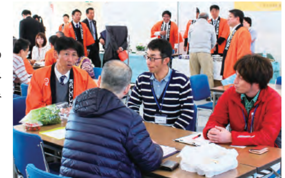
旭ウレシイ商談会

千葉県内農業産出額1位(農林水産省より)である旭市において、特色ある農畜産品等での販路拡大・PRを行いたい生産者の方と、地産地消による仕入で他店との差別化を図りたい事業者の方との商談会「旭ウレシイ商談会」を開催。初めて商談に参加される方も多く、商談件数は60件に上りました。また、商談だけでなく、地元事業者同士の交流も盛んに行われました。