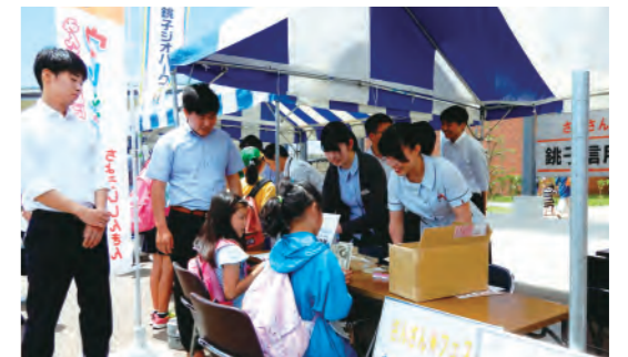
さんさん★フェスタ2018

千葉県民の日を記念した海匠地区(銚子市・旭市・匝瑳市)のイベント「さんさん★フェスタ2018」が、銚子市「千葉科学大学マリーナキャンパス」を会場に開催されました。当金庫のブースでは、模擬紙幣を利用した職場の体験や名刺の作成などを行い、多くの子供たちに参加いただきました。