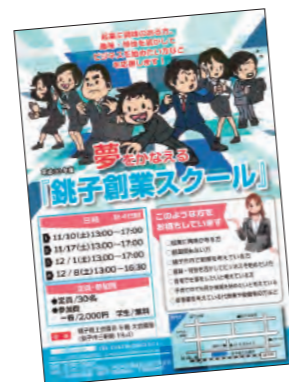
銚子創業スクール