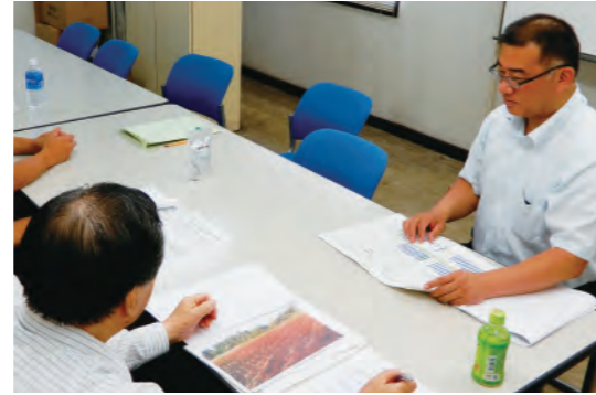
経営改善計画のご提案

また、お取引先企業のライフステージに発生するさまざまな課題に対する解決策を検討・提案することを目的に本部3部署(営業推進部・審査部・管理部)および営業店が連携した支援態勢を構築しています。