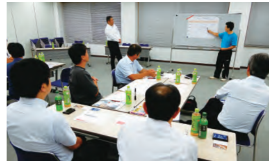
さんむエコノミックガーデニング

行政や商工会議所、金融機関などが連携しながら、地元の中小企業が活動しやすく、成長できるビジネス環境をつくることを目指して設置された「さんむエコノミックガーデニング推進協議会」に会員として参加しています。2018年度は、お金の流れを考えるワークショップ「ベーシックマネー講座」に講師として協力しました。