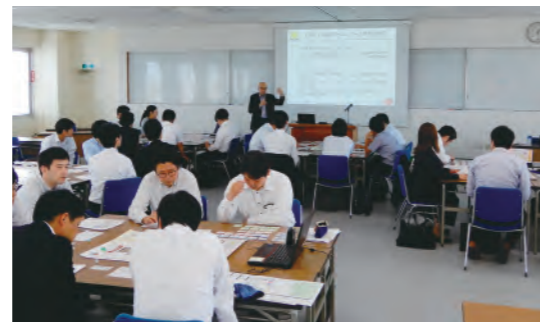
経営サポート研修会