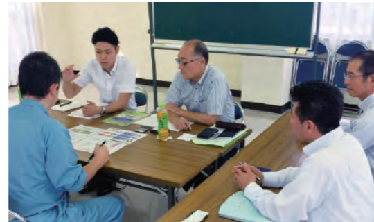
事業承継の個別相談会

後継者さまへのスムーズな事業承継をサポートすることを目的に、「千葉県事業引継ぎ支援センター」と連携し、銚子、旭、千葉・東金、夷隅、茨城の各ブロックで、事業承継の個別相談会を実施しました。また、M&A支援についても、(株)ランピアや信金キャピタル(株)等と連携して取り組んでいます。