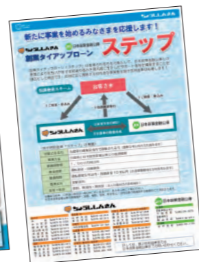
創業ティアアップローン「ステップ」