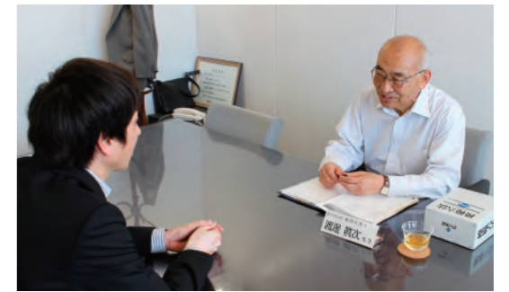
お客さま無料相談会

法律・税務相談については月1回、年金・労務管理の相談については随時受付しています。