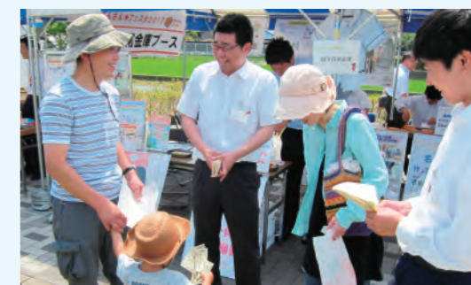
さんさん★フェスタ2017

千葉県民の日を記念した海匝地区（銚子市・旭市・匝瑳市）のイベント「さんさん★フェスタ2017」が旭文化の杜公園を会場に開催されました。当金庫のブースでは、模擬紙幣を利用した職場の体験や名刺の作成などを行い、多くの子供たちに楽しんでいただきました。