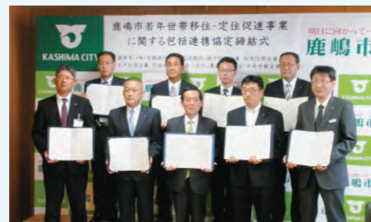
鹿嶋市との連携協定

当金庫営業エリア内の市町村が進めている地方版総合戦略の施策実施に対して、積極的に参画・協力しています。また、地域との連携の更なる強化を図るべく、観光振興、定住促進、子育て支援など、地域の活性化や地域社会の発展に資することを目的とした連携協定を銚子市、旭市、匝瑳市、勝浦市、いすみ市、茂原市、東金市、鹿嶋市（順不同）と締結しています。