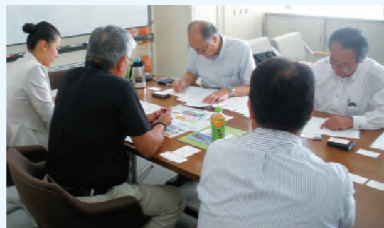
事業承継の個別相談会

後継者さまへのスムーズな事業承継をサポートすることを目的に、外部専門機関等とも連携した支援活動を実施しています。29年度は、「千葉県事業引継ぎ支援センター」と連携し、銚子、旭、千葉・東金、夷隅、茨城の各ブロックで、事業承継の個別相談会を実施しました。また、M&A支援についても「信金キャピタル(株)」と連携して取り組んでいます。