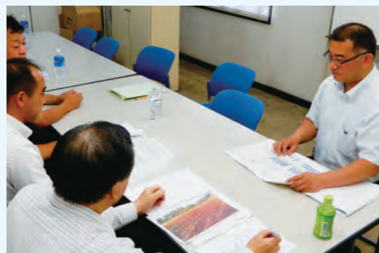
経営改善計画のご提案

また、お取引先企業のライフステージに発生するさまざまな課題に対する解決策を検討・提案することを目的に本部3部署(営業推進部・審査部・管理部)および営業店が連携した支援態勢を構築しています。