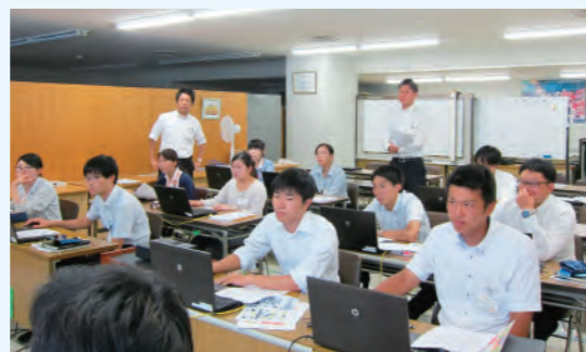
経営改善計画策定研修会

お取引先企業のライフステージに応じた質の高い金融サービスを提供するため、コンサルティング能力向上にかかる金庫内研修の実施や外部研修への派遣を積極的に行っています。