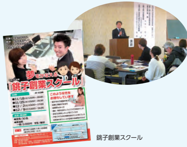
銚子創業スクール