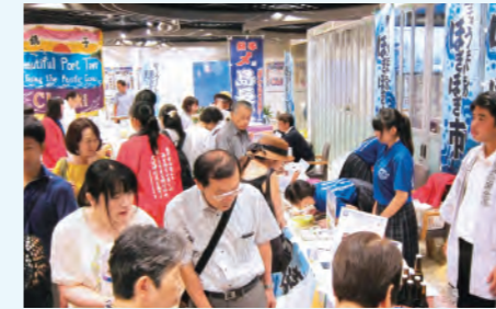
銚子のうまいものほぎほぎ市 in TOKYO

銚子市の各種団体が連携して推進する「銚子市アグリ&マリンツーリズム構築事業『銚子市魅力発信プロジェクト』」に参画し、市内の中小企業・小規模事業者の域外への新たな販路開拓支援の機会の提供や商品等の改良・販売力向上に向けた支援に取り組んでいます。