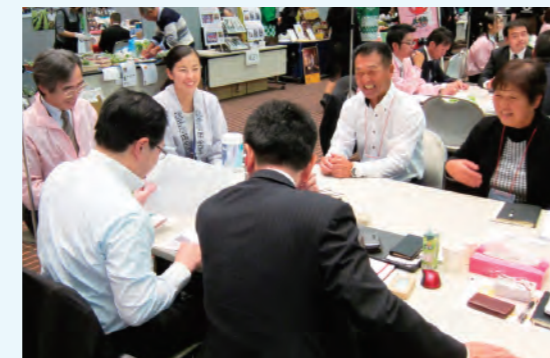
しんきん食の商談会

千葉県内の5信金共催で、第7回目となる「しんきん食の商談会」を幕張メッセ国際会議場で開催しました。参加されたお客さま(出席者)は、バイヤーとの交渉の中で、商品力の向上や新製品のヒントを得るなど有意義な商談会となりました。