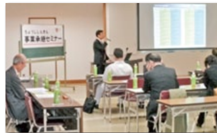
「ちょうしんきん事業承継セミナー」