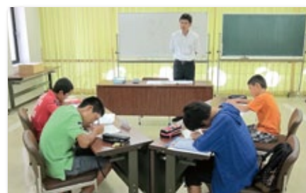
「ゆめ・仕事ぴったり体験」