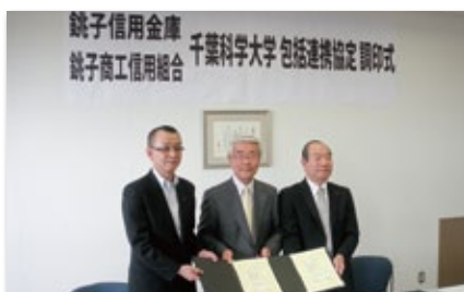
「千葉科学大学と包括連携協定書の締結」