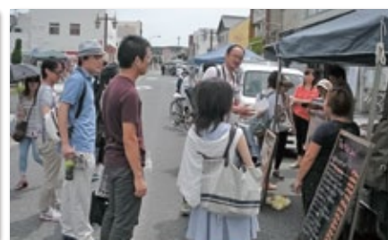
「地域診断プロジェクト2014@銚子」