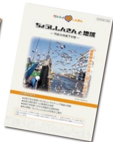
広報誌「ちょうしんきんと地域」