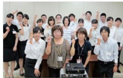
「認知症サポーターの養成」

平成26年度以降は、新入職員を対象として、継続的に「認知症サポーター」の養成に取り組んでいます。