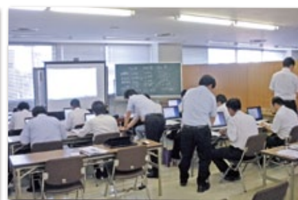
「改善計画策定システム活用に向けた研修会」