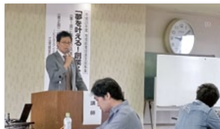
「創業セミナー&創業スクール」

銚子市が推進している産業競争力強化法に基づく「創業支援事業計画」(平成26年10月31日認定、27年2月27日計画変更認定)に、当金庫は創業支援事業者として参画し、銚子市およびその他の創業支援事業者と連携して、創業希望者に対する経営、財務、人材育成、販路開拓など、創業に繋がる支援事業を実施しています。