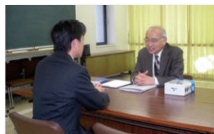
「お客さま無料相談会」