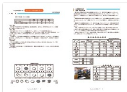
ちょうしんきん景況レポート