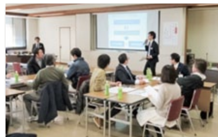
「ちょうしんきん経営塾21」