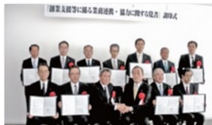
「創業支援等に係る業務連携・協力に関する覚書」締結

独立行政法人中小企業基盤整備機構の創業・第二創業促進補助金のご案内活動と申請手続きのサポートも実施しています。