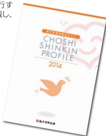
銚子信用金庫のすべて