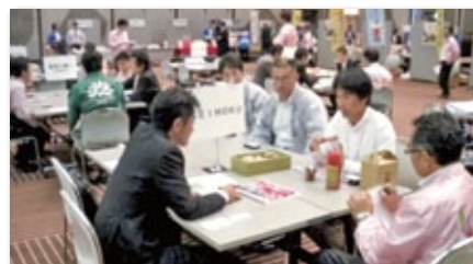
「平成26年度しんさん食の商談会」