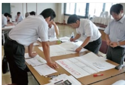
「外部専任講師による経営改善計画策定研修会」