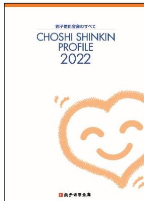
ディスクロージャー誌