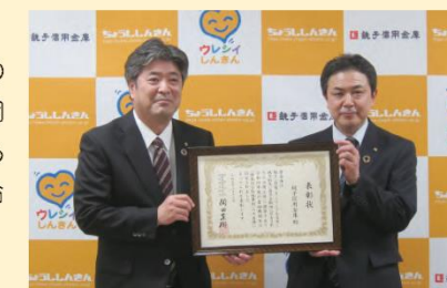
内閣府特命担当大臣より表彰

2023年3月13日、東庄町における「人口減少が進むエリアでの廃校の有効活用」としての取組みが、内閣官房デジタル田園都市国家構想実現会議事務局が認定する「地方創生に資する金融機関等の『特徴的な取組事例』」に選定され、内閣府特命担当大臣(地方創生担当)より表彰されました。