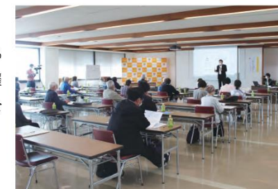
ウレシイくらしのセミナー

「地域のお客さまへ、日常の暮らしに直結する様々な情報をご提供すること」を目的に、2018年度から「ウレシイくらしのセミナー」を各地区で開催しています。2022年度は、銚子地区、東金地区、夷隅地区にて「終活」をテーマに開催し、延べ78名のお客さまにご参加いただきました。