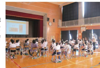
金融教育出前授業

「お金の使い方を学ぼう!」をテーマに、銚子市内小・中学校6校で金融教育出前授業を行い、延べ191名の児童にお金の役割や使い方について学んでいただきました。今後も「未来を担う子供たちへの金融教育・教育機会の提供」を目的に、積極的に取り組んでまいります。