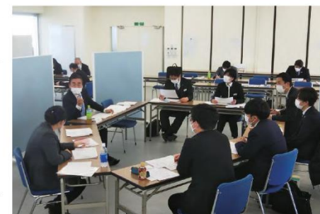
事業承継案件検討会

M&A支援については、M&A仲介会社と連携して取り組んでいるほか、近隣エリアでの小規模なM&Aの実現を支援する独自サービス「ちょうしんきんM&Aサポート」に取り組んでいます。「事業承継」と「事業の発展」という2つの課題を解決することで、「雇用の維持」と「地域経済の活性化」を実現することを目指し、専門家と連携しながら一貫したサポートを行っています。