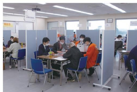
第5回旭ウレシイ商談会

2022年度も、「第5回旭ウレシイ商談会」を開催し、11先の事業者の方々に参加いただき、34件の商談が行われました。