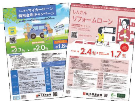
エコカー・住宅エコ設備等金利割引のご提供

当金庫のSDGsへの取組みの一環として、電気自動車など環境にやさしい車を新車で購入する方、オール電化等のエコ設備を修繕・購入する方を対象に金利割引を実施しております。詳しくは営業店窓口または営業担当者までお問い合わせください。