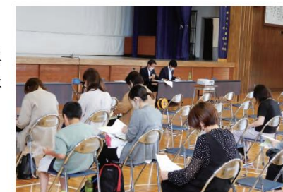
教育資金についての説明会

地域の高等学校にて、進学を控えたお子さまを持つ保護者の方を対象に、大学進学に係る費用について理解を深めていただくことを目的とした「教育資金についての説明会」を開催しています。