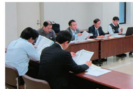
経営改善計画のご提案

当金庫では、お取引先企業のライフステージに発生するさまざまな課題に対する解決策を検討・提案することを目的に、本部および営業店が連携して支援する態勢を構築しています。