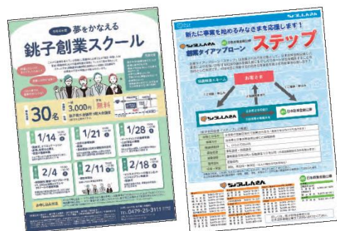
桃子創業スクール

2022年度も、地方公共団体や外部関係機関等と連携したサポート活動を行い、当金庫営業エリア内の創業機会の増加に努めました。