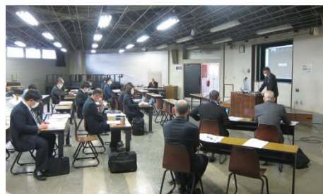
中小企業向け省エネセミナー

国際的に温室効果ガスの排出量削減に向けた取組みが進められているなか、中小企業においても脱炭素の視点を織り込んだ経営（脱炭素経営）の重要性が高まっています。当金庫では、「省エネルギー設備投資に係る利子補給金」事業の指定金融機関として、省エネ診断や各種補助金申請のサポートなどを含め、脱炭素経営に向けた支援に積極的に取り組んでいます。