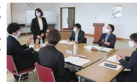
マネジメントスキル向上研修会