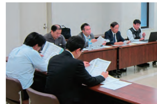
経営改善計画のご提案