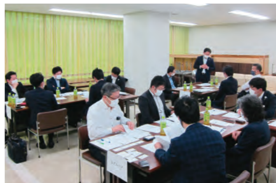
専門家とのM&A勉強会

後継者さまへのスムーズな事業承継をサポートすることを目的に、「千葉県事業承継・引継ぎ支援センター」と連携し、銚子、旭、千葉・東金、夷隅、茨城の各ブロックで、個別相談会を実施しました。また、「千葉県弁護士会」や「千葉県中小企業診断士協会」と連携し、お客さまに応じた専門家の紹介を行える体制としています。M&A支援については、(株)ランビや信金キャピタル(株)等と連携して取り組んでいるほか、近隣エリアでの小規模なM&Aの実現を支援する独自サービス「ちょうしんきんM&Aサポート」に取り組んでいます。「事業承継」と「事業の発展」という2つの課題を解決することで、「雇用の維持」と「地域経済の活性化」を実現することを目指し、専門家と連携しながら一貫したサポートを行っています。