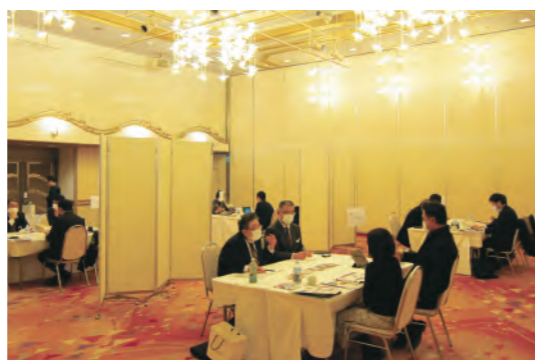
銚子のうまいもの商談会

2020年度は、地域の事業者さまの商品が「銚子ブランド」となるよう、商品の魅力を磨き上げながら、独自の商談会を通じた販路開拓サポートを行いました。