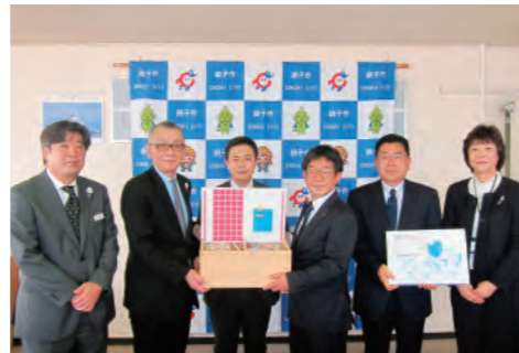
「ウレシイ・リサイクル」玩具等の贈呈式

本活動は、ちょうしんきん110周年記念事業の一つとして企画したもので、銚子市内店舗および東庄支店でペットボトルの回収を行い、2021年3月15日には、収益金により購入した玩具や紙芝居を、銚子市第四保育所へ寄贈しました。2021年度も継続して「ウレシイ・リサイクル」に取り組み、地域の皆さまとのエコ活動を通じた地域社会への還元を目指してまいります。