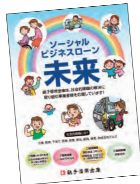
ソーシャルビジネスローン「未来」

また、2020年8月より、環境問題等の社会的課題の解決に取り組む事業者の方を資金面からサポートする「ソーシャルビジネスローン『未来』」のお取扱いを開始しました。その他、省エネ診断や各種補助金の申請サポートも行っております。詳しくは、営業店窓口または営業担当者までお問い合わせください。