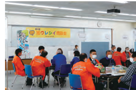
第3回旭ウレシイ商談会

新型コロナウイルスの「感染拡大予防ガイドライン」に基づいた対策を実施したうえで開催となりましたが、33件の商談が行われ、「有意義な商談会だった」との声も多く寄せられました。