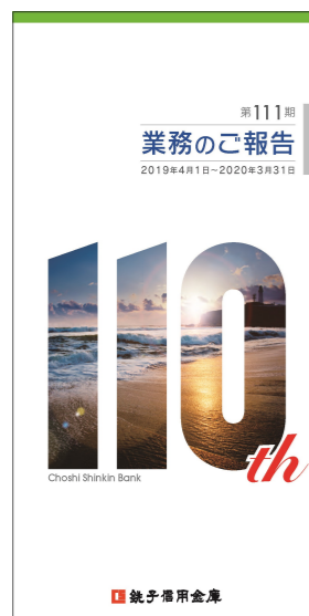
第111期 業務のご報告

「地域密着型推進計画」を策定し、中小企業金融の円滑化と地域経済の発展に向けて取り組んでいます。「地域密着型推進計画」の具体的な取組みについては、7月と11月の年2回発行するディスクロージャー誌および当金庫ホームページへ掲載し、地域の利用者のみなさまに対する情報発信に努めています。