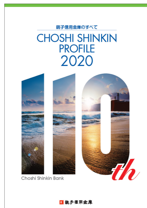
銚子信用金庫のすべて2020