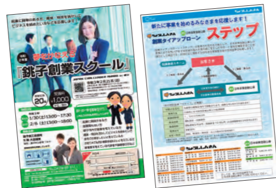
銚子創業スクール

2020年度も、地方公共団体や外部関係機関等と連携したサポート活動を行い、当金庫営業エリア内の創業機会の増加に努めました。