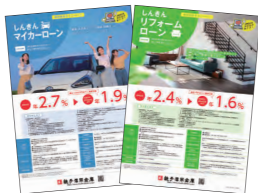
エコカー・住宅エコ設備等 優遇金利割引のご提供