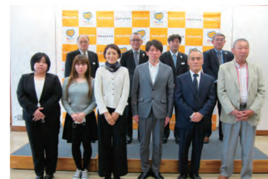
ちょうしんきんリデザイン・コンテスト表彰式

エントリー商品3点に対し、24点ものリデザイン案が寄せられ、その中から各商品1点の優勝デザインが決定されました。