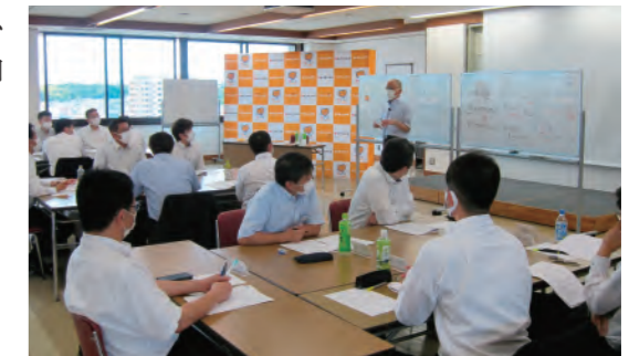
コーチングスキル向上研修会