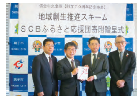
「SCBふるさと応援団」寄附贈呈式