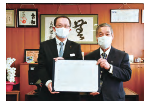
東庄町との連携協定の締結

空き公共施設の有効利用に資する情報交換や、災害時の復興・復旧対策および感染症対策支援、創業・事業承継支援、地域産業・製品のビジネスマッチングや販路開拓支援等について、連携して取り組んでまいります。