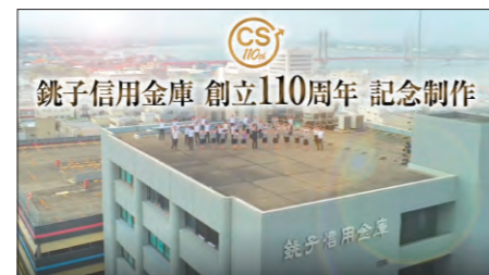
銚子信用金庫創立110周年記念動画