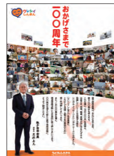
創立100周年ポスター