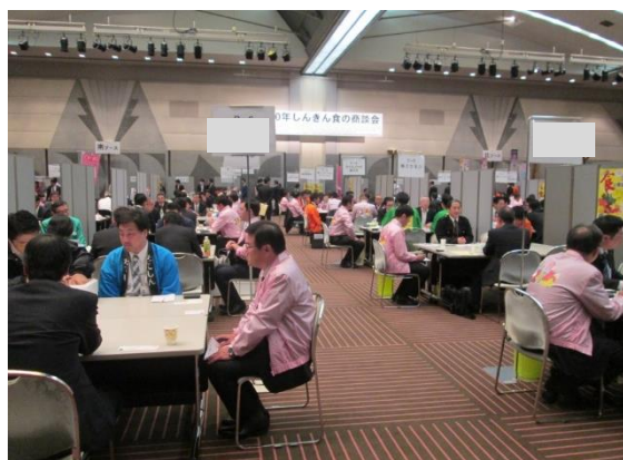
個別商談のイメージ